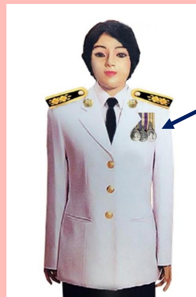
เครื่องแบบเต็มยศและครึ่งยศ

ประดับแพรแถบ เหรียญที่พระราชทานเป็นที่ระลึก ในโอกาสต่าง ๆ แบบบุรุษ ที่อกเสื้อเบื้องซ้าย