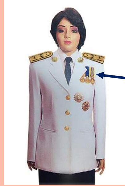
เครื่องแบบครึ่งยศ

เหรียญราชอิสริยาภรณ์ เช่น เหรียญจักรพรรดิมาลา เหรียญที่พระราชทานเป็นที่ระลึก ในโอกาสต่าง ๆ ให้ประดับโดยใช้แพรแถบ แบบบุรุษ