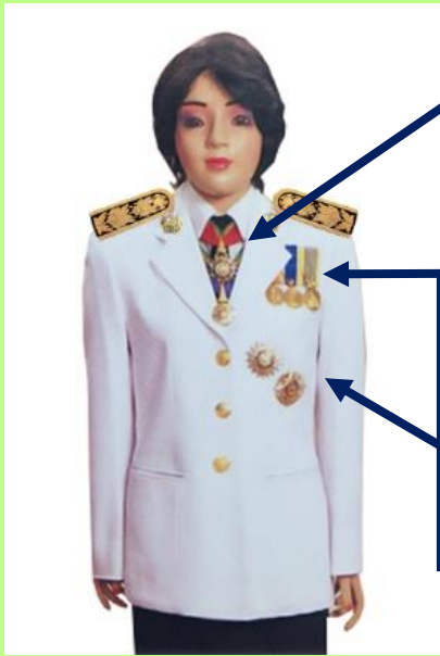
เครื่องแบบเต็มยศและครึ่งยศ (ประดับเครื่องราชอิสริยาภรณ์เหมือนกัน)

เช่น ท.ช., ท.ม. (เดิมประดับหน้าบ่าเสื้อมิตดารา)