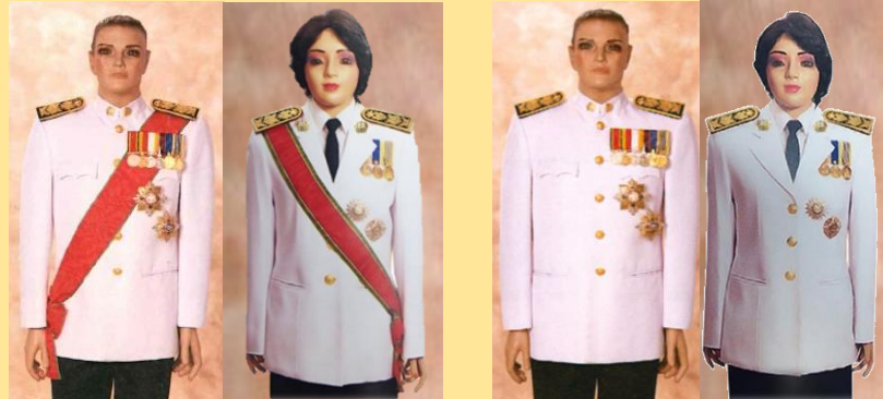
ป.ม. - ป.ช. สะพายบ่าขวา, ม.ว.ม. - ม.ป.ช. สะพายบ่าซ้าย

ชนิดมีสายสะพาย เต็มยศ ครึ่งยศ (ไม่สวมสายสะพาย)