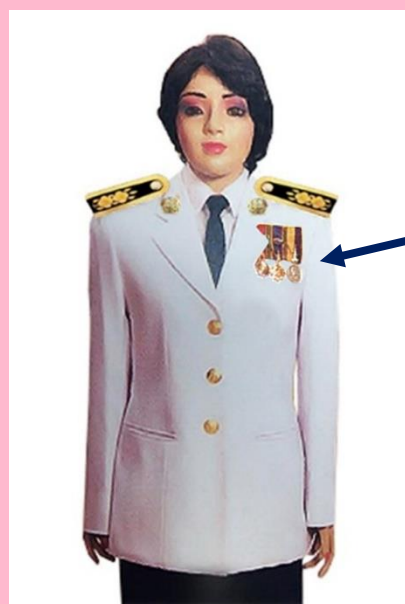
เครื่องแบบเต็มยศและครึ่งยศ (ประดับเครื่องราชอิสริยาภรณ์เหมือนกัน)

เช่น จ.ช., จ.ม., บ.ช., บ.ม., ร.ท.ช., ร.ท.ม., ร.ง.ช., ร.ง.ม.