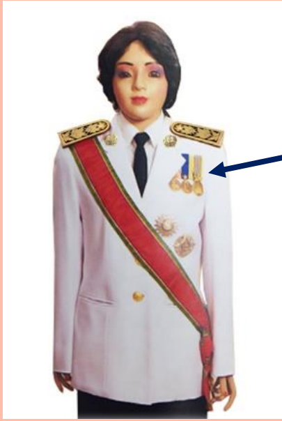
เครื่องแบบเต็มยศ

ประดับดารา ดวงตรา และสวมสายสะพายเช่นเดิม